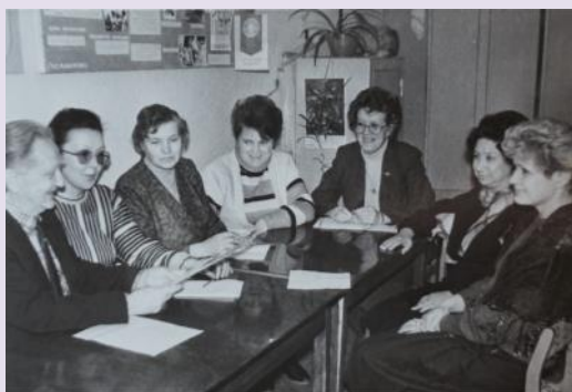
Заседание на кафедре, 1989 год