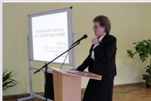
Неделя психологии в ТГУ, 2013 год